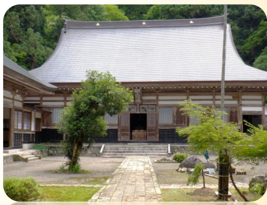
国登録有形文化財(H24年登録)