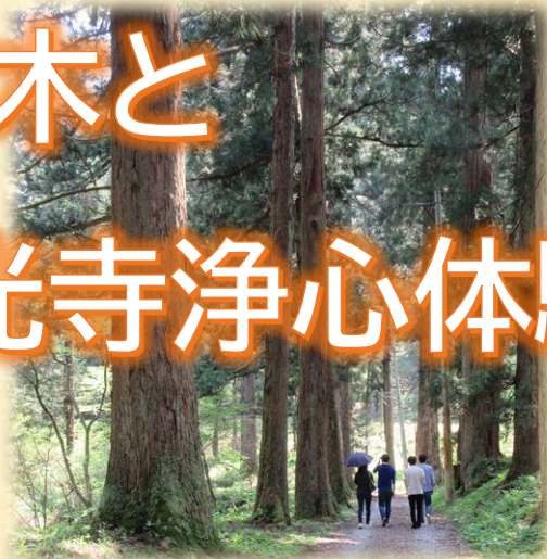
新潟県指定天然記念物(S50年指定)